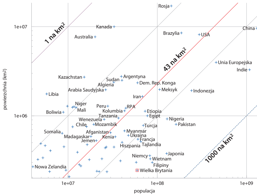
Rys. J.2. Liczba ludności oraz powierzchnie krajów i regionów na świecie. Obie skale są logarytmiczne. Linie ukośne wyznaczają stałą gęstość zaludnienia. Rys. pokazuje więcej szczegółów fragmentu rys. J.1 (str. 351).